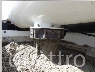
Die BreMAT S3.17 XL Quattro kann auch für die Herstellung einer hochwertigen dickflüssigen EPS-Schüttung eingesetzt werden.