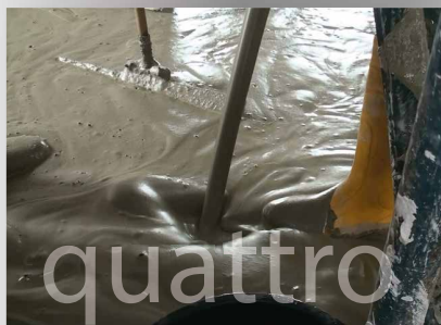
Bei der Quattro-Ausführung kann ein Schaumgenerator Schaum produzieren und in den flüssigen Mörtel injizieren um so Schaummörtel herzustellen.