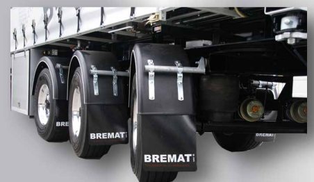
Das 3-Achs-Aufliegerfahrgestell entspricht den neuesten Sicherheits- und Qualitätsanforderungen und ist mit der europäischen Typengenehmigung versehen.