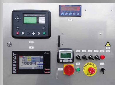
Das computergesteuerte System ist mit dem fortschrittlichen Touchscreen-Display einfach zu bedienen.