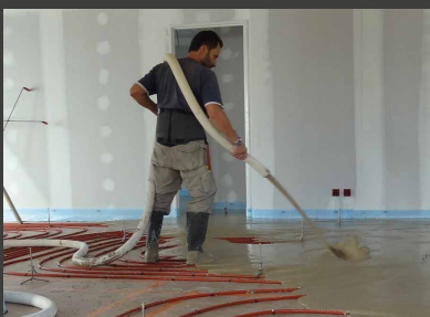
Die genaue Materialdosierung garantiert die Herstellung eines homogenen und qualitativ hochwertigen Fließestrichs.

Material- und Lohnkosten sind wegen des selbst durchgeführten Materialtransports, Kaufs der Materialien in Schüttiladungen und vollautomatischen Füllens des Mixers deutlich niedriger. Restmengen werden einfach zu der nachfolgenden Baustelle mitgenommen.