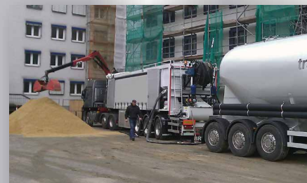
Durch das horizontale Produktionssystem kann die Anlage während des Herstellungsprozesses nachgeladen werden.