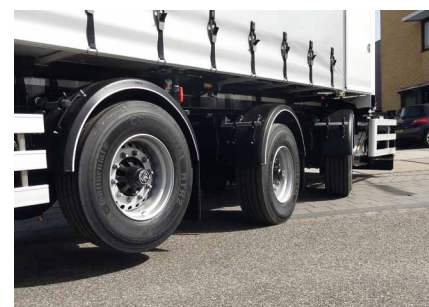
Das Widespread-Aufliegerfahrgerüst sorgt mit drei 10-Tonnen-Achsen, wovon zwei Lenkachsen, für einen perfekten Wenderadius und optimale Gewichtsverteilung.