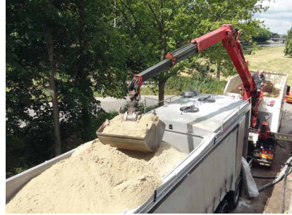
Durch das horizontale Produktionssystem kann die Anlage während des Herstellungsprozesses mit Sand und Bindemittel nachgeladen werden.