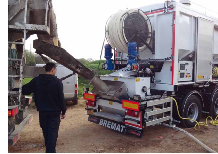
Die Anlage ist zum Laden mit vorgemischtem Mörtel geeignet. Insbesondere wenn der dafür speziell entwickelte Trichter verwendet wird.