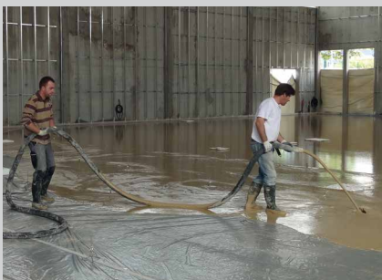
Die genaue Materialdosierung garantiert die Herstellung eines homogenen und qualitativ hochwertigen Fließestrichs.

Vor allem für Märkte wie die Niederlande und Skandinavien, wo das zulässige Gesamtgewicht von 50 Tonnen oder mehr erlaubt ist, kann die BreMAT S3.20 XLS eine perfekte Lösung sein.