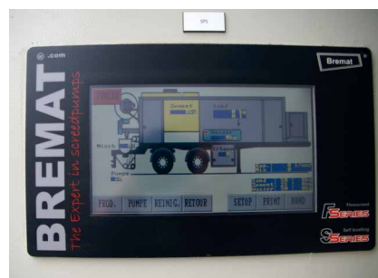
Das computergesteuerte System ist mit dem fortschrittlichen Touchscreen-Display einfach zu bedienen.

Material- und Lohnkosten sind wegen des selbst durchgeführten Materialtransports, Kaufs der Materialien in Schüttladungen und vollautomatischen Füllens des Mixers deutlich niedriger. Restmengen werden einfach zu der nachfolgenden Baustelle mitgenommen.