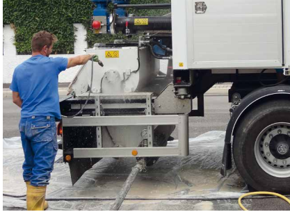
Die leicht zugänglichen Mischer an der Rückseite der Anlage sind leicht zu reinigen.