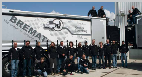
Wir stehen gerne für Sie bereit und liefern Ihnen die beste Anlage für Ihren Bedarf, sowie einen ausgezeichneten Service!

Zusätzlich bietet BreMAT auch maßgeschneiderte Lösungen für das Mischen und Fördern von verschiedenen Mörteltypen wie EPS-Schüttung, Schaummörtel und PUR-Material.